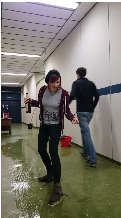
Abbildung 1: Der SCHRUBBSCHUH v880p im Einsatz

Die Semester-Auftaktparty sprengte wieder alles vorher Dagewesene. Sehr viele verloren geglaubte Seelen kamen zurück und tranken voller Lebenslust 90 Bierkästen, Berge Shots leer und unglaubliche Mengen an Cocktails. Aus den Trümmern der Party ist eine episches Konstrukt aus Holz, Borsten und Kabelbindern emporgestiegen. Der SCHRUBBSCHUH v880p (siehe Abbildung 1) der ultimative Gerät zum Bodenpolieren.