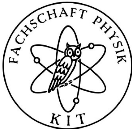
neues Logo (inkl. Wahl)