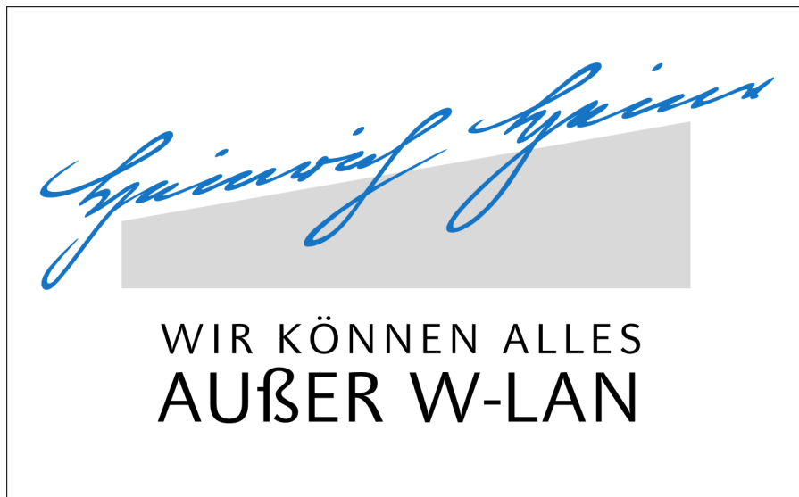
Abbildung 2: Dies ist ein schöner Aufkleber, der mittlerweile auch auf Professoren-Laptops klebt

Wir befinden uns im Jahre 50 nach Gründung der HHU. Die ganze Uni ist zulassungsbeschränkt. Die ganze Uni? Nein! Eine von unbeugsamen Naturwissenschaftlern bevölkerte Fakultät hört nicht auf, der bösen Rektorin Gaja Julia Cäsa Widerstand b zu leisten c . Und die Verwaltung leistet sich auch einiges, z.B. neue WLAN-Router. Die verbessern das Netz zwar erheblich, die nicht-Eduroam-konforme Whitelist verhindert aber weiterhin, dass Steam funktioniert. Und das prangern wir jetzt an. Das stellen wir zur Diskussion. Irgendwer ist Schuld daran, dass hier niemand zocken kann. Und das prangern wir an. d